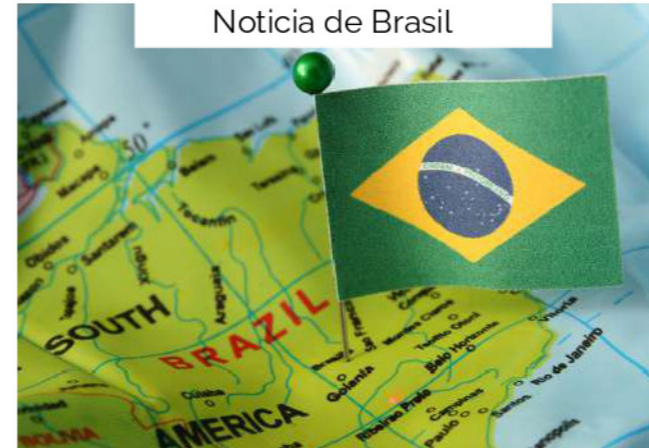
Noticia de Brasil

Turquía implementa nuevas regulaciones para fortalecer el cumplimiento en precios de transferencia, requiriendo una mayor documentación y transparencia en las transacciones entre empresas relacionadas. Estas medidas buscan asegurar que los precios aplicados reflejen el valor de mercado y reducir riesgos de evasión fiscal. Con este cambio, Turquía se alinea con los estándares internacionales en precios de transferencia, aumentando el control tributario en el país.