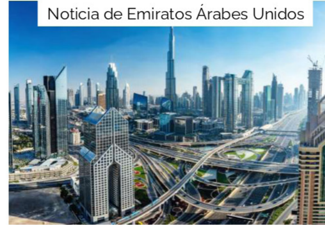
Noticia de Emiratos Árabes Unidos

Sudáfrica intensifica su enfoque en el cumplimiento tributario de las criptomonedas y su impacto en precios de transferencia. La autoridad fiscal exige que las empresas declaren sus transacciones en criptoactivos y aseguren que se ajusten a valor de mercado en operaciones internacionales. Estas medidas buscan prevenir la evasión y garantizar la transparencia en un sector en crecimiento.