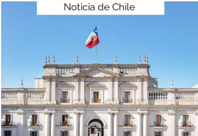
Noticia de Chile

El reciente fallo sobre Apple resalta la importancia del cumplimiento en precios de transferencia para las multinacionales. Este caso enfatiza la necesidad de una documentación sólida y transparente en transacciones intragrupo para evitar sanciones y ajustes fiscales. Se recomienda a las empresas evaluar continuamente sus políticas de precios de transferencia y contar con asesoría especializada para mitigar riesgos fiscales.