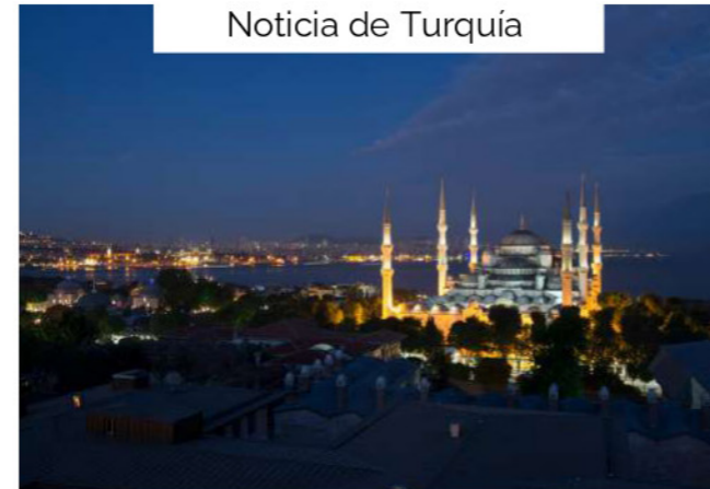
Noticia de Turquía

Emiratos Árabes Unidos introduce requisitos específicos para la divulgación de precios de transferencia, orientados a reforzar la transparencia y el cumplimiento fiscal en operaciones entre empresas relacionadas. Las nuevas normas requieren una documentación exhaustiva que demuestre que los precios aplicados están en línea con el valor de mercado. Esto forma parte de los esfuerzos por alinearse con los estándares internacionales y reducir la evasión fiscal en el país.