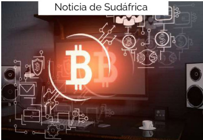
Noticia de Sudáfrica

Chile implementa nuevas medidas de cumplimiento tributario en precios de transferencia para reforzar la transparencia fiscal. Las autoridades exigen mayor documentación y análisis comparativos en transacciones entre empresas relacionadas, asegurando que los precios se ajusten al valor de mercado. Estas medidas buscan prevenir la evasión fiscal y mejorar el control de la administración tributaria en el país.