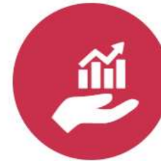
INSTITUCIONES DEL ECOSISTEMA